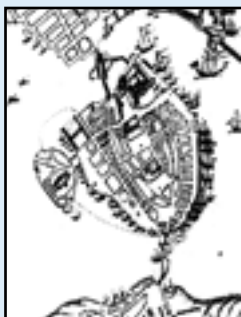
Karta från 1642 över Stockholm med Gamla stan och Riddarholmen.

Stockholms innerstad är en av Sveriges största fornlämningar med lämningar från tidig medeltid och framåt. Stockholms läge mellan Östersjön och Mälaren har resulterat i en maritimt präglad historia med ett stort antal fynd av bland annat vrak. Undersökningarna inför Citybanan är ett av de mest omfattande undervattensarkeologiska projekt som genomförts i Sverige.