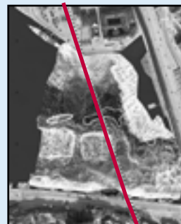
Multi beam kartering över Riddarfjärden. Den röda linjen markerar tunnelsträckningen.